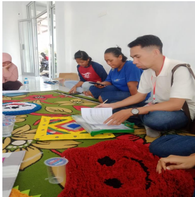
Gambar 1. Kegiatan FGD