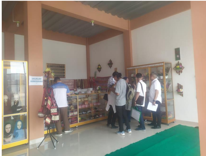
Gambar 4. Monitoring dan Evaluasi Kegiatan Pendampingan

berjalan dengan baik, dengan demikian pelaksanaan kegiatan ini sudah berjalan dengan efektif.