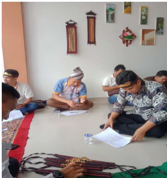
Gambar 2. Kegiatan Evaluasi kegiatan Pendampingan

Tahapan evaluasi merupakan tahapan akhir yang dilakukan setelah semua tahapan dilaksanakan. Proses pada tahapan evaluasi dilakukan oleh tim pendamping untuk mengukur dan mengevaluasi keberhasilan pendampingan yang sudah dilakukan.