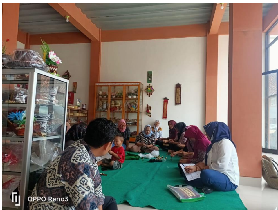
Gambar 3. Kegiatan Penyusunan Rencana Kerja