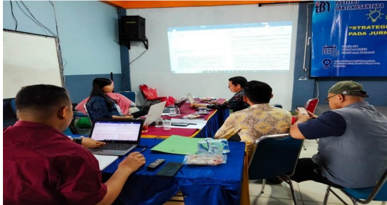
Gambar 2. Proses Penyusunan Jadwal Kegiatan PkM