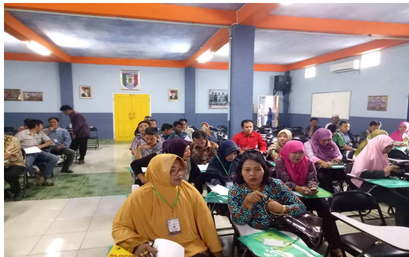
Gambar 3. Kegiatan Sosialisasi