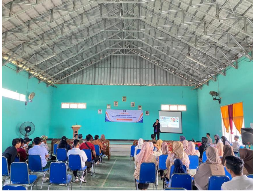
Gambar 2. Paparan Materi Digital Marketing Oleh Tim PkM