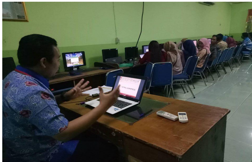
Gambar 3. Paparan Materi dan Praktek Pemasaran Digital

Tim Pendamping memberikan panduan teknik/cara memanfaatkan teknologi melalui internet khususnya e-commerce sebagai sarana sistem pengembangan sistem penjualan berbasis online. Memberikan kesempatan kepada peserta pelatihan untuk mengaplikasikan dan bertanya mengenai hal-hal yang belum jelas selama pemaparan materi sehingga peserta semakin mengerti tentang materi yang telah disampaikan.