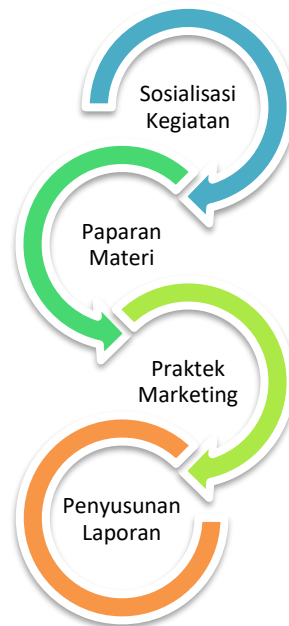
Gambar 1. Tahapan Kegiatan PkM

Sosialisasi Kegiatan dilakukan sebelum acara pada hari pelaksanaan dilakukan yaitu dengan cara menyebarkan pampflet, undangan, sosialisasi di media social, dan Menyusun jadwal serta petugas pada saat kegiatan dilaksanakan. Hal ini penting dilakukan karena akan mempengaruhi sukses dan tidaknya acara yang akan dilakukan.