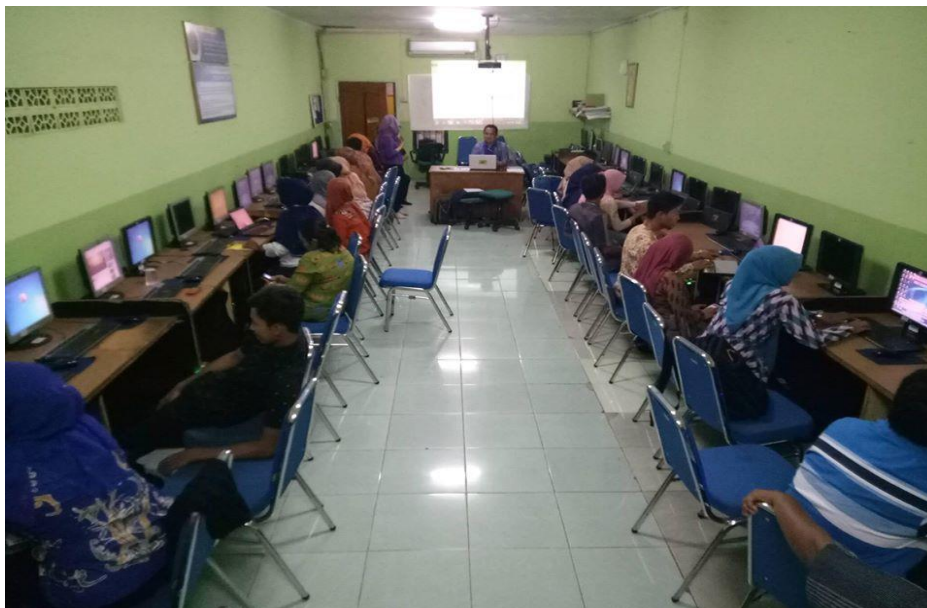
Gambar 4. Prakatek Peserta Di Lab Komputer

Penyusunan Laporan Kegiatan pendampingan masyarakat memiliki beberapa fungsi penting yang melibatkan dokumentasi, evaluasi, dan pengkomunikasian hasil kegiatan. Catatan tertulis tentang apa yang telah terjadi selama pendampingan masyarakat. Ini mencakup deskripsi kegiatan, tanggal, lokasi, peserta yang hadir, materi yang disampaikan, dan tindakan yang diambil selama kegiatan. Dokumentasi ini penting untuk referensi masa depan dan sebagai bukti pelaksanaan kegiatan dan Evaluasi Kinerja.