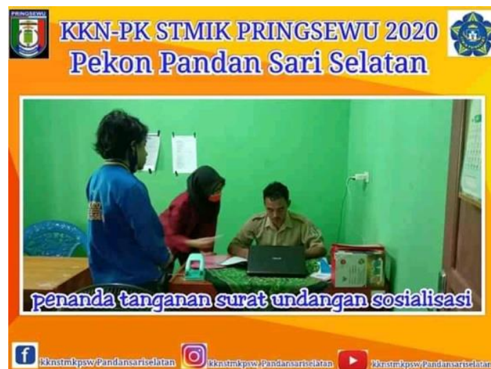
Gambar 2. proses pembuatan surat undangan sosialisasi dan tanda tangan

Pelaksanaan PkM dilakukan tahapan demi tahapan dari nol sampai acara dilaksanakan di gedung aula dan melalui berbagai proses seperti koordinasi, verifikasi, minta izin dan sebagainya. PKM dikembangkan untuk mengantarkan mahasiswa mencapai taraf pencerahan kreativitas dan inovasi berlandaskan penguasaan sains dan teknologi serta keimanan yang tinggi. Dalam rangka mempersiapkan diri menjadi pemimpin yang cendekiawan, wirausahawan serta berjiwa mandiri dan arif, mahasiswa diberi peluang untuk mengimplementasikan kemampuan, keahlian, sikap, tanggungjawab, membangun kerjasama tim maupun mengembangkan kemandirian melalui kegiatan yang kreatif dalam bidang ilmu yang ditekuni.