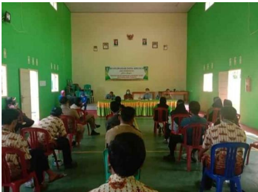
Gambar 4. rapat dengan perangkat desa untuk membahas sosialisasi