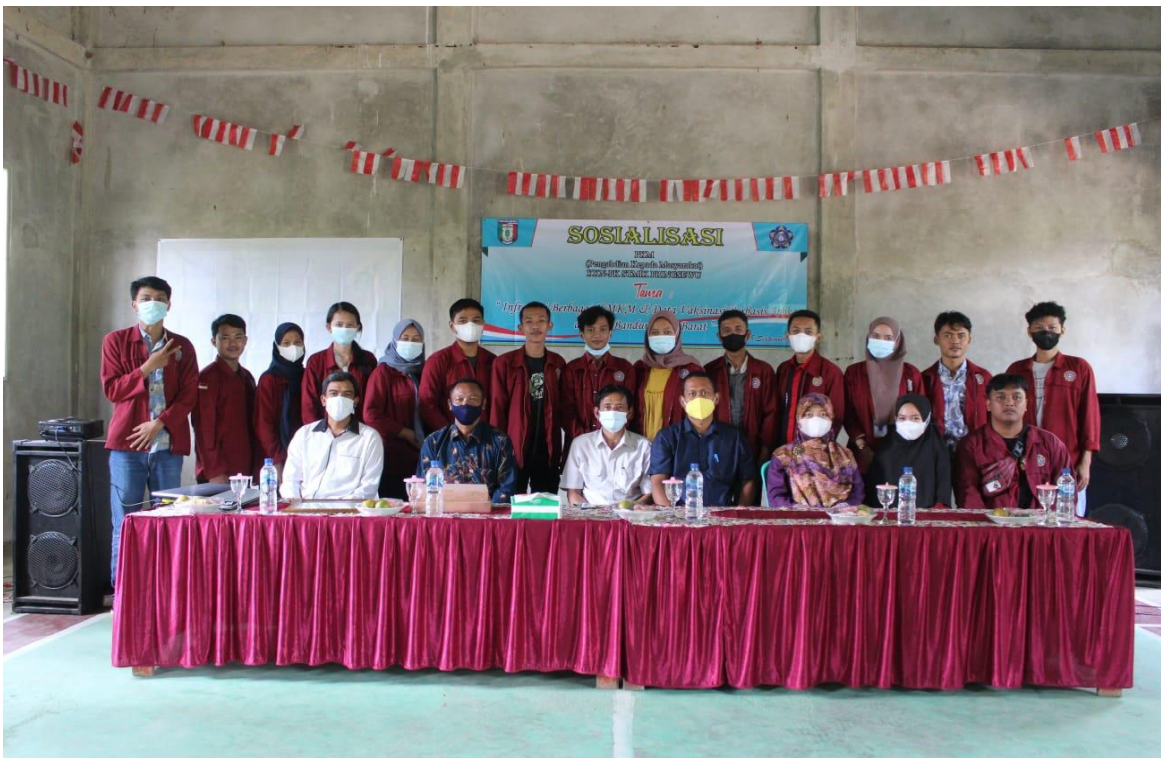
Gambar 6. Kegiatan Sosialisasi PkM Tema Informasi Berbagai UMKM (UMKM Go