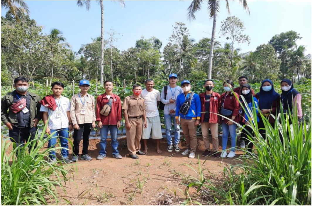
Gambar 3. Kegiatan Kunjungan ke tempat UMKM Perkebunan Timun Suri