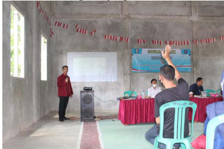
Gambar 2. Hasil Persentasi Cara Menggunakan Aplikasi Informasi UMKM Go Online

Pelaksanaan PKM dilakukan tahapan demi tahapan dari nol sampai acara dilaksanakan di GSG Pekon Bandungbaru Barat dan melalui berbagai proses seperti koordinasi, verifikasi, permohonan izin dan sebagainya. PKM dikembangkan untuk mengantarkan mahasiswa mencapai taraf pencerahan kreativitas dan inovasi berlandaskan penguasaan sains dan teknologi serta keimanan yang tinggi. Dalam rangka mempersiapkan diri menjadi pemimpin yang cendekiawan, wirausahawan serta berjiwa mandiri dan arif, mahasiswa diberi peluang untuk mengimplementasikan kemampuan, keahlian, sikap, tanggung jawab, membangun kerjasama tim maupun mengembangkan kemandirian melalui kegiatan yang kreatif dalam bidang ilmu yang ditekuni.