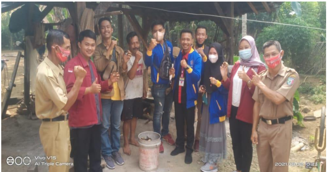
Gambar 4. Kegiatan Kunjungan ke tempat UMKM Gula Aren & Gula Kelapa