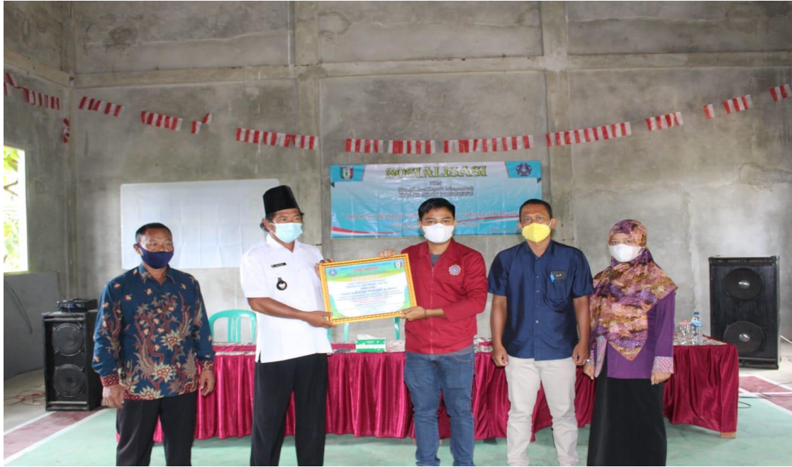
Gambar 5. Penyerahan Sertifikat Sosialisasi PkM Tema Informasi Berbagai UMKM