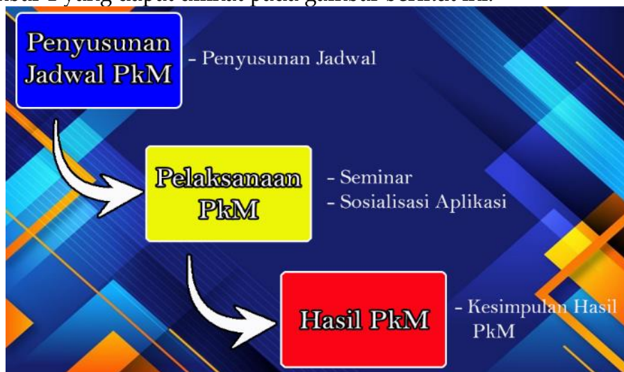
Gambar 1. Alur Pelaksanan PkM

Dalam pelaksanaan kegiatan ini, pertama melakukan penyusunan rencana metode yang akan dilakukan selama proses awal sosialisasi dan rencana selama kegiatan berlangsung. Alur proses pengabdian kepada masyarakat dapat dilihat pada gambar 1 yang dapat dilihat pada gambar berikut ini: