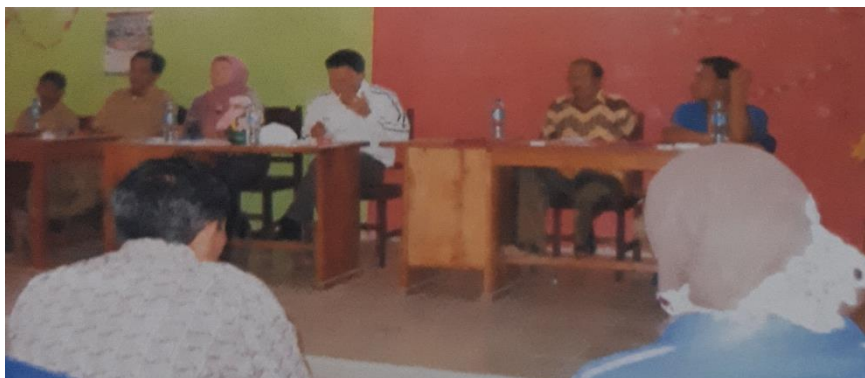
Gambar 4. Arah dan pelatihan mengembangkan inovasi produk

Pendampingan inovasi produk bertujuan untuk meningkatkan mutu dan kualitas produk hasil dari home industry sehingga nantinya dapat bersaing dengan produk-produk yang ada dipasaran. Hasil pendampingan ini berupa pengembangan dan inovasi dari produk yang sudah ada sehingga akan memiliki banyak variasi sehingga masyarakat/konsumen banyak pilihan. Kegiatan pendampingan dapat dilihat pada gambar berikut :