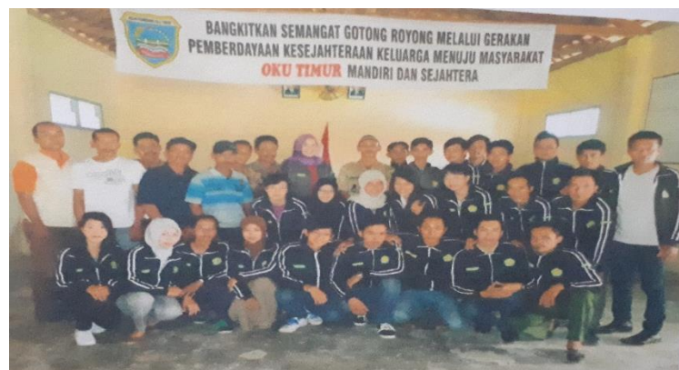
Gambar 2. Arahan Kepada Tim PkM