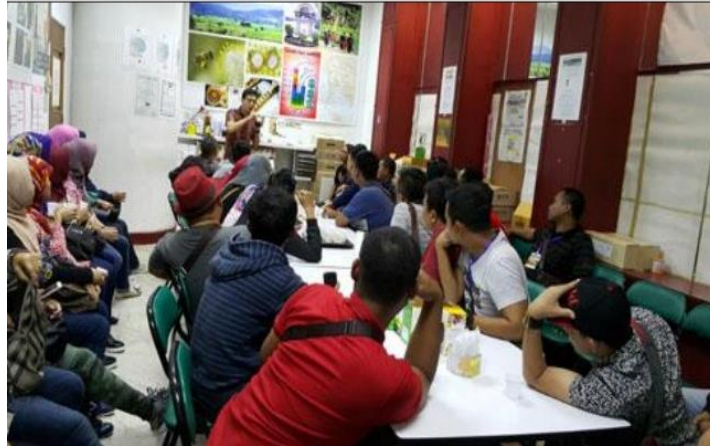
Gambar 5. Pendampingan Strategi Pemasaran Online