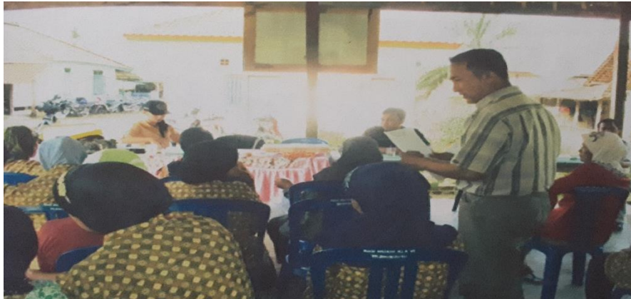
Gambar 3. Foto Kegiatan Pendampingan Pembukuan Keuangan Usaha

mingguan, bulanan dan tahunan. Contoh laporan keuangan sederhana bagi pelaku usaha dapat di lihat pada gambar :